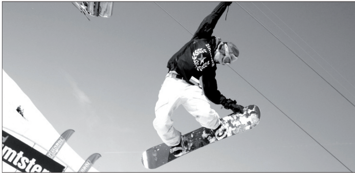
SNOW. Este deporte supera en práctica al esquí. /A.M.

El programa "Ayudas a la Producción" del Área de Juventud del Ayuntamiento incentiva la realización de cortometrajes, videos, espectáculos de danza y teatro entre otros para jóvenes de 15 a 35 años.